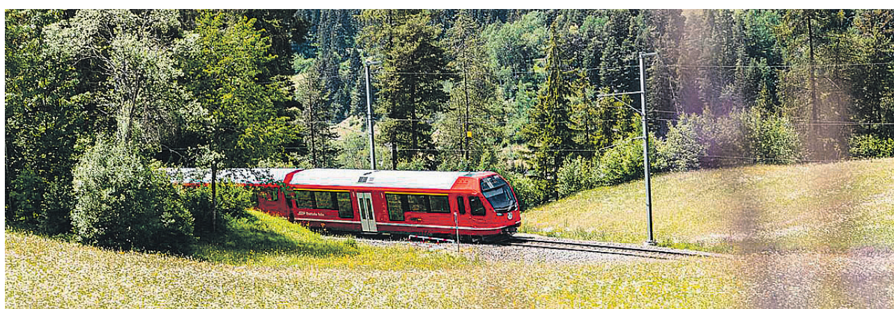
Capricorn bei Filisur

Erneut präsentiert die Rhätische Bahn (RhB) ein stark durch die Corona-Pandemie geprägter Jahresabschluss, diesmal jedoch mit Zeichen einer leichten Erholung. Im Jahresergebnis der RhB-Gruppe kann für das Geschäftsjahr 2021, nach COVID-19-Finanzhilfen im Personenverkehr, ein kleiner Gewinn von 274 000 Schweizer Franken ausgewiesen werden. Dazu beigetragen haben eine leichte Erholung im Personenverkehr sowie positive Ergebnisse in den Segmenten Autoverlad, Güterverkehr und Immobilien. Die Investitionstätigkeit blieb hoch, wenn auch leicht unter dem Spitzenwert von 2020. Für das Jahr 2022 bleiben die Aussichten aufgrund der aktuellen politischen und wirtschaftlichen Lage noch unsicher.